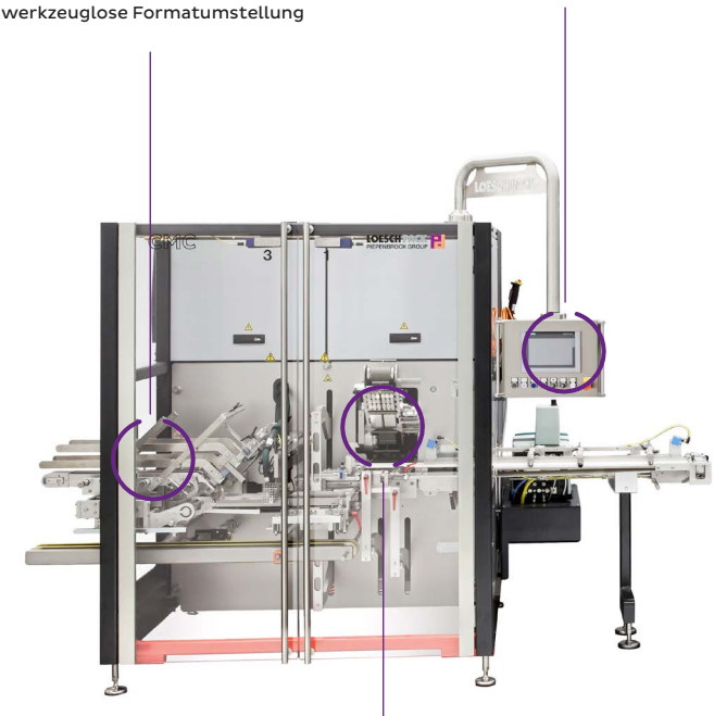
Exzellenter Hygiene- und Ergonomiestandard durch Frontplattenbauweise